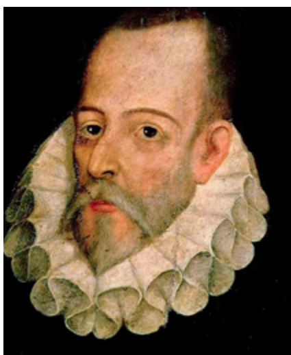
Miguel de Cervantes (1547-1616)

Le Don Quichotte de Cervantes est un monument, considéré même comme le tout premier roman de la littérature moderne. Il est composé de deux parties, écrites à 10 ans d'intervalle et narre les aventures d'un chevalier rêveur, éperdu d'héroïsme et d'une vision idéale de la chevalerie, qui déchanté au contact de la réalité.