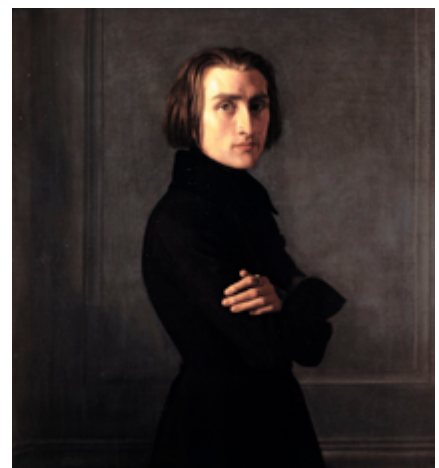
Frantz Liszt (1811-1886)

C'est enfin Richard Strauss qui donnera ses lettres de noblesse au poème symphonique, puisant son inspiration dans le patrimoine littéraire européen. Il en compose ainsi une dizaine dont le plus célèbre est sans doute Ainsi parlait Zarathoustra composé en 1896 d'après Nietzsche, choisi plus tard par Stanley Kubrick comme bande originale pour son film 2001 L'Odyssée de l'espace .