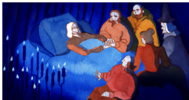
Final : La mort de Don Quichotte

On perçoit le thème de la folie qui s'évapore petit à petit. Même la mort du héros est mise en musique par un filet de violoncelle qui cloture l'œuvre, comme le dernier soupir du personnage.