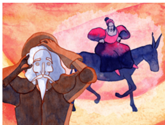
Var. 6 : Dulcinée

À la fin de l'œuvre, Don Quichotte rentre chez lui et Strauss fait entendre tous les thèmes qui résument ses aventures.